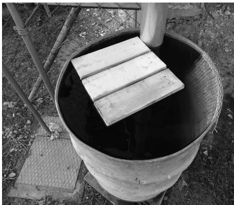
Nádrže s vodou opatříme plovákem nebo přes hranu ohneme kus pletiva, aby se topící živočichové snadno dostali ven.