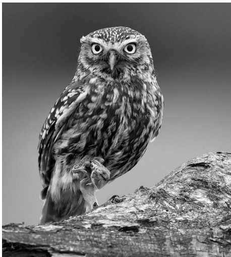
Sýček obecný.

Sýček dříve obýval otevřenou krajinu a hnízdil v ovocných stromech či hlavatých vrbách, nevyhýbal se ani velkým městům, kde sídlil v parcích a zahradách. Dnes u nás ale žije posledních 100–130 párů sýčků,