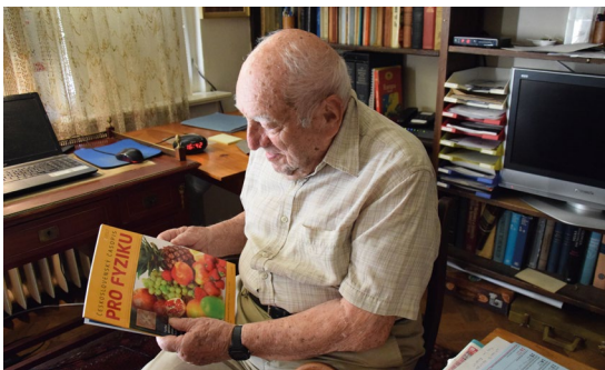
Různorodost a kvalitu informací v Československém časopise pro fyziku vysoce oceňuji.

„Když děláš věci s láskou, dáváš tím lidem ve svém okolí doživotní vzpomínku, že jsi tu pro ně byl...“ Jan Tříška