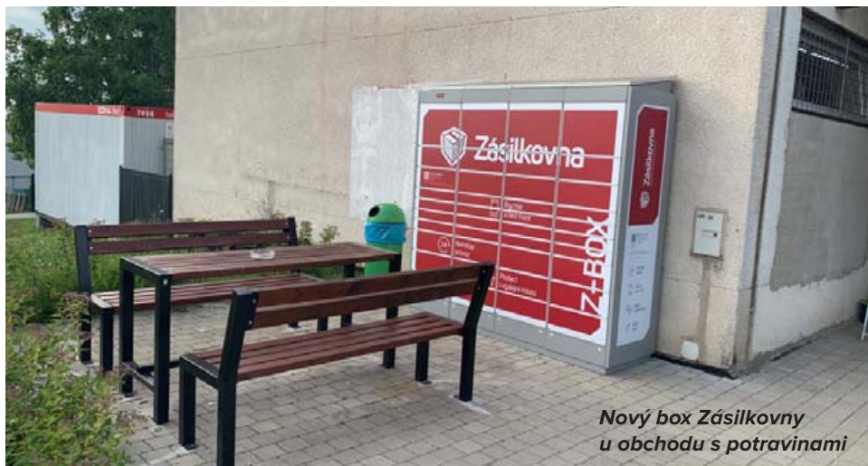
Nový box Zásilkovna u obchodu s potravinami

7. Rádi bychom dokončili poslední prostor u Kulturního domu ve Světicích. S těmito pracemi bychom chtěli začít nejspíše na podzim. Dojde k vybudování garáže a nového skladu pro údržbu a nové terasy u KD Světice, což už jsem Vám před časem prezentoval v minulých číslech věstníku U Nás doma.