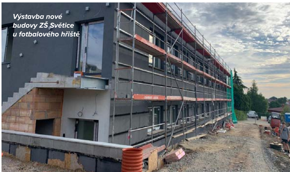
Výstavba nové budovy ZŠ Světica u fotbalového hřiště

Tentokrát bych se pokusil informaci zkrátit a uvést vše v termínech, které jsou již skoro na dveřích: