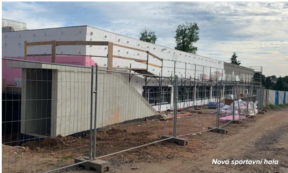
Nová sportovní hala

objezd, který bude definovat jasná pravidla všem řidičům a chodcům tak, aby zde nemohlo dojít k nějakému zranění. Vše by mělo být dokončeno do konce 10/2021. Tím bude celý projekt dotažen do očekávaného konce, ke kterému se obec zavázala. Samozřejmě postupně budeme pokračovat s komunikací ul. U Hřiště až k samoobsluze, ale vzhledem k tomu, že jsme nebyli úspěšní při žádosti o poskytnutí dotace, tak se to možná bude táhnout o něco déle, než bylo v plánu, ale nedá se nic dělat.