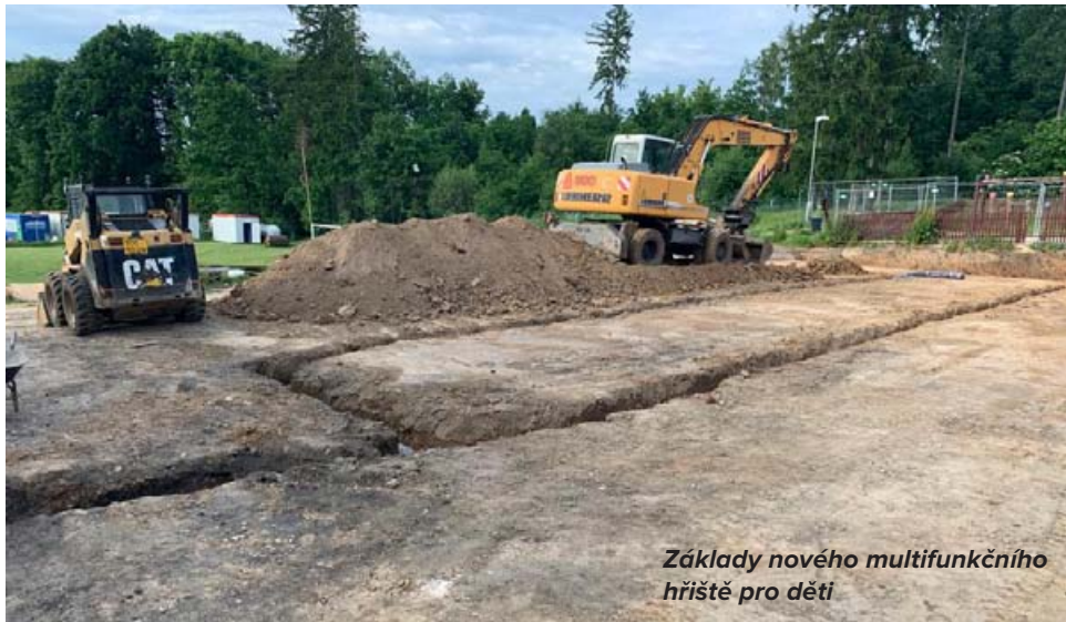
Základy nového multifunkčního hřiště pro děti

12. Multifunkční hřiště je další téma, které nás letos čeká a rozhodně ho budeme chtít dokončit. Naším cílem je optimalizace