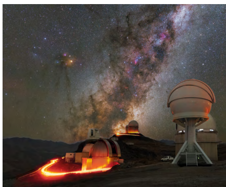
Obr. 1 Mléčná dráha nad Dánským dalekohledem (1,54) v La Silla.

Odkaz na webové stránky IAU: https://www.iau.org/news/announcements/detail/ann18051/