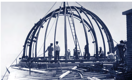
Obr. 1 V roce 1941 v náročných válečných podmínkách probíhala stavba kopulí observatoře na Skalnatém plesu.