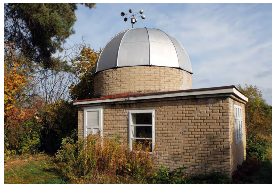
Obr. 5 Bečvářova hvězdárna v Brandýse nad Labem funguje dodnes – a sice jako meteorologická observatóf.

len dolná stanica lanovky a prvé dva stožiare, ktoré boli čiastočne poškodené delostreleckou paľbou z Popradu.“