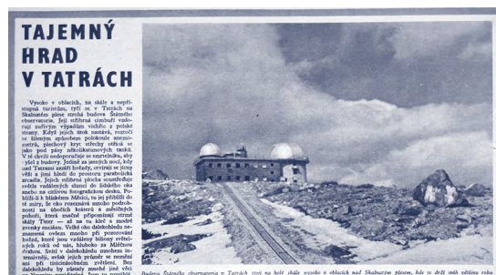
Obr. 2 Populární tisk nazval v článku z roku 1947 observatoř na Skalnatém plesu „Tajemným hradem v Tatrách“.