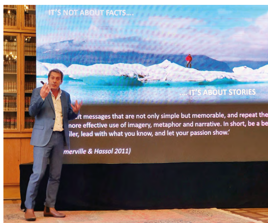
Obr. 3 Konference hostila renomované britské vědecké komunikátory, na snímku Iain Stewart.