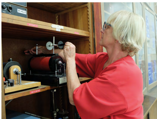
Obr. 3 Za dlouholeté výborné výsledky v přírodovědných, zejména fyzikálních soutěžích byl škole 1. ledna 1999 propůjčen čestný název Gymnázium Christiana Dopplera.

vzniklo gymnázium jako čtrnáctá jedenáctiletá střední škola sloučením 3. a 4. národní školy, 3. střední školy a jazykového gymnázia v budově dnešního Arcibiskupského gymnázia v Praze na Vinohradech.