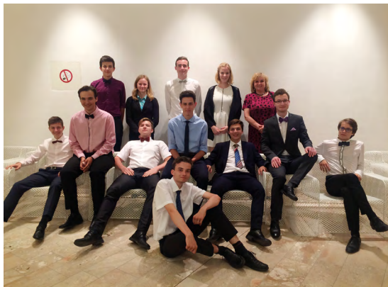
Obr. 4 Gymnázium má od roku 2002 statut školy s Německým jazykovým diplomem (DSD II), od školního roku 2015/2016 navíc s DSD I. Kromě toho škola připravuje žáky na jazykové zkoušky z anglického jazyka (FCE, CAE) a také z francouzského jazyka (DELF a DALF).

I když se názvy a adresy Gymnázia Christiana Dopplera poměrně často měnily, jeho zaměření zů-