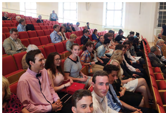
Obr. 2 Společné setkání zástupců Gymnázia Christiana Dopplera a Gymnázia v Salcburku – stejného jména – při příležitosti konference k 170. výročí narození Christiana Dopplera v Salcburku.

vyprávění, v hlavě mi vytanula jedna věta z mého pojednání o fyzikálním vzdělávání 1 a o učitelích, kteří zapalují v hlavách svých žáků ty pověstné ohně živící poznání... O těch, co dokážou nadchnout a učí srdcem. Pokud existují takoví učitelé, pak o dobré vzdělávání nemusíme mít obavy.