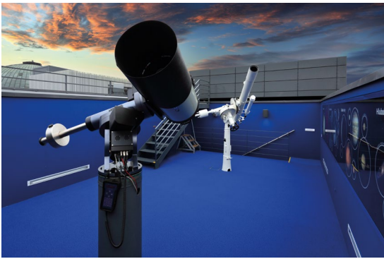
Obr. 4 Na Hvězdárně a planetáriu Brno probíhají i pozorování vesmírných úkazů a objektů.

zit povrchy nejrůznějších kosmických těles, ale zprostředkovává i jiné vědecké vizualizace. Princip celého projekčního systému je svým způsobem jednoduchý: sestává z několika datových projektorů, které pomocí speciální optiky promítanou obraz na celou plochu ve tvaru polokoule s průměrem 17 metrů. Ty pak doplňuje několik přídatných zařízení a nezbytný software.