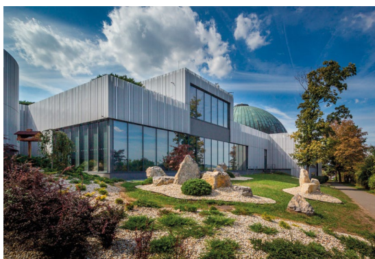
Obr. 1 Pořad Sedmikrásky online vysílá Hvězdárna a planetárium Brno.

Kraví hora se svojí nadmořskou výškou 305 m n. m. nepatří k těm příliš vysokým, ale přesto se nad městem Brnem hezky vypíná a z proskleného atria hvězdárny je nadmíru pěkný výhled do kraje. Tato kulturně-vzdělávací instituce začala působit v roce 1954 a jedním z jejích ředitelů byl i výše jmenovaný Zdeněk Mikulášek. Od roku 2008 je ředitelem Hvězdárny a planetária Brno