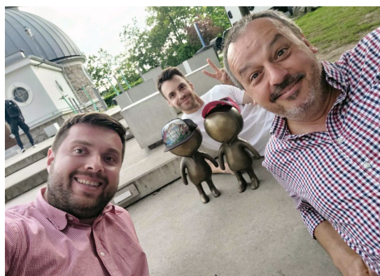
Autoři Sedmikrásek s novými maskoty brněnské hvězdárny, které najdete před hlavním vchodem.

Naladit Sedmikrásky online lze na profilu Hvězdárny a planetária Brno na Facebooku a YouTube (youtube.com/c/HvezdarnaCzBrno), kde je možno si vybrat z mnoha desítek dílů. Jednou měsíčně pak Sedmikrásky vysílají i na všech regionálních stanicích Českého rozhlasu. A my za redakci Československého časopisu pro fyziku přejeme pořadu i jeho tvůrcům mnoho dalších zajímavých dílů Sedmikrásek online.