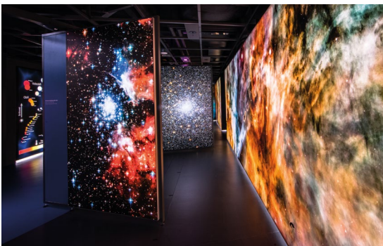
Obr. 5 V prostorách hvězdárny jsou instalovány aktuální tematické vesmírné výstavy.