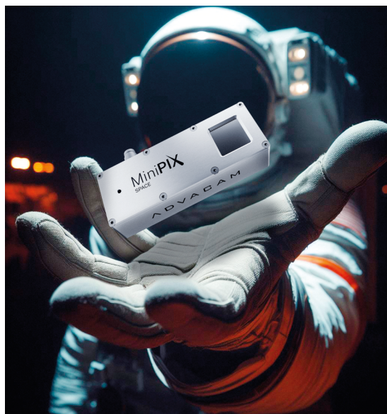
Obr. 1 Vizualizace kamery MiniPIX SPACE pro monitoring kosmického záření, dodávané provozovatelům družic nově pod značkou AdvaSpace.

Všechny tyto komplikace dokážou dobře vyřešit detekční technologie, které umožňují sledovat každou jednotlivou částici nebo natáčet nebývale citlivá barevná rentgenová videa. Přístroje umožňující digitální rentgenové zobrazování a detekci částic vyrábí česká technologická skupina AdVisiones Technologies, jejíž motto zní: „Od vesmíru po medicínu. Od laboratoří po umění. Od drobných detailů po neočekávané důsledky. Neúnavně hledáme nové aplikace pro nejpokročilejší zázraky zobrazování pomocí počítání fotonů.“