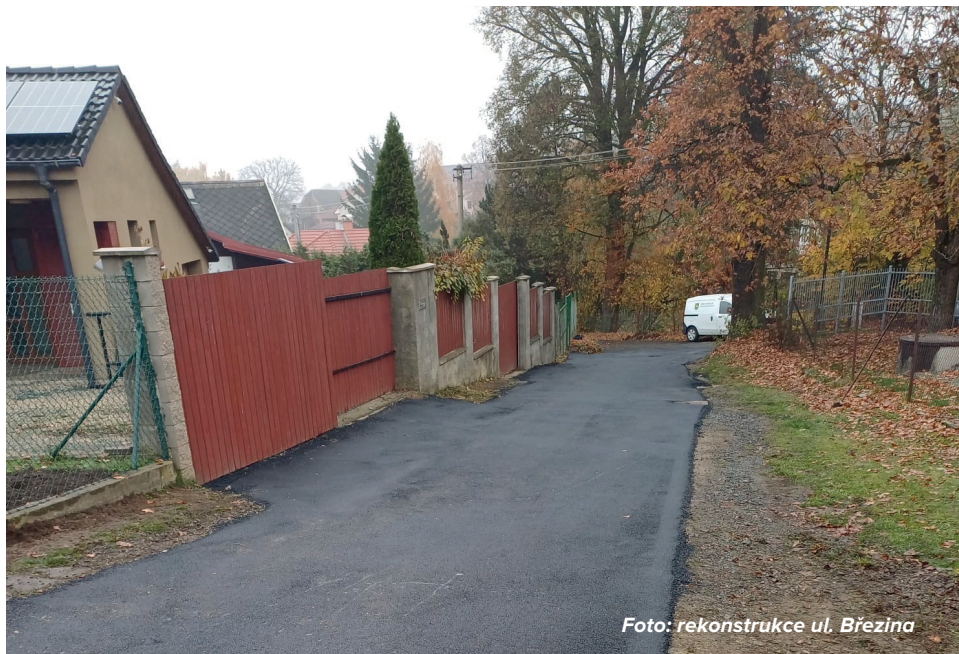
Foto: rekonstrukce ul. Březina