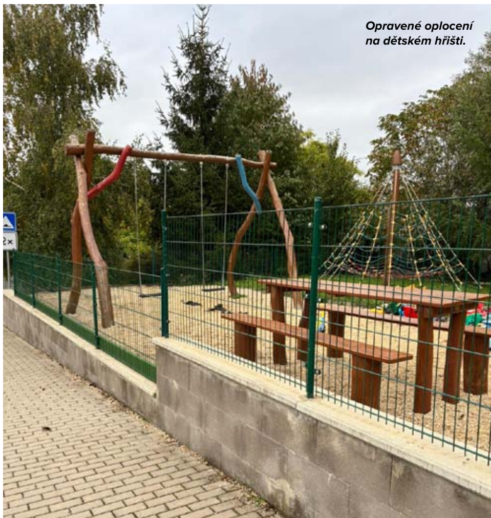
Opravené oplocení na dětském hřišti.

7. V současné době probíhají jednání se Správou železnic a věřím, že bychom se mohli do konce roku 2025 dočkat lepšího osvětlení v místě podchodu pod tratí, kterého hojně využívají všichni, kteří jezdí vlakem. Již dlouho si tento fakt uvědomujeme, ale jednání nyní postoupila správným směrem, tak věřím, že to brzy dobře dopadne.