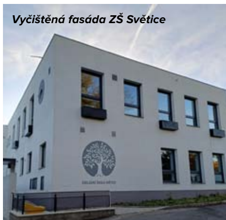
Vyčištěná fasáda ZŠ Světice

4. Práce na přivaděči do Tehova rovněž pokračují v plném proudu a pokud nenastanou nějaké větší komplikace, tak by stavba měla být dokončena do 4/2026. Tímto nám bude zajištěn samostatný přívod vody do obce Světice, která dosud přes náš vodojem dále putovala do obce Tehov. Vlastně jsme se o vodu částečně dělili. Mnohokrát se nám stávalo, že objem 200 m 3 v letních měsících nestačil, resp. byl na samotné hraně. To už nám nyní odpadne, protože oněch 200 m 3 již bude vždy a pouze jen pro naši obec. Navíc v obci Tehov vyrostou 2 vodojemy o objemu celkových 400 m 3 , takže bude umožněno v případě, že by došlo k nějakému porušení přivaděče do Světic z obce Všestary, doplňovat náš vodojem i z druhé strany, tj. z obce Tehov. Vzniká tedy i další nouzové řešení, které nám zajistí, že by naše obec neměla snad nikdy být bez vody. Opět se jedná o velmi důležitý posun v této oblasti a mám z toho velkou radost.