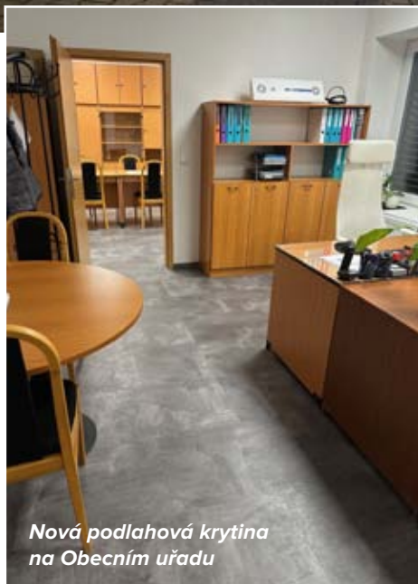
Nová podlahová krytina na Obecním úřadu

5. Obec pracuje i na údržbě svých nemovitostí. Cílem je udržovat všechny objekty v dobré kondici, a to jak po technické stránce, tak i po vizuální stránce. Během podzimních prázdnin jsme se rozhodli pro vyčištění fasády objektu ZŠ Světica II. stupně, U Zvoničky 179, opravili jsme nevzhledně vypadající sloup u objektu č.p. 419, který byl poškozený od projíždějících vozidel, v rámci obecního úřadu momentálně pracujeme na výměně podlahové krytiny, tak věříme, že vše bude pro Vás příjemné a budete z toho mít radost stejně jako my.